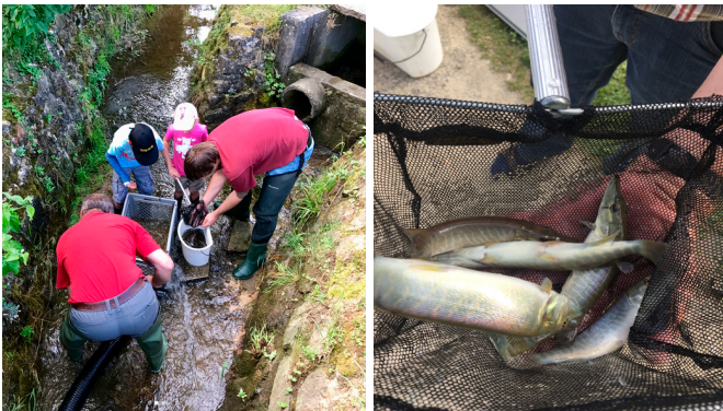
Abfischen und Zählen