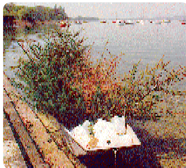
Viel Material muss für die Egli-Laichhilfe bereitgestellt werden

Bojen, Tannli und Verankerungen sind inzwischen geräumt und die kleinen Egli können bereits in Schwärmen an der Uferzone beobachtet werden.